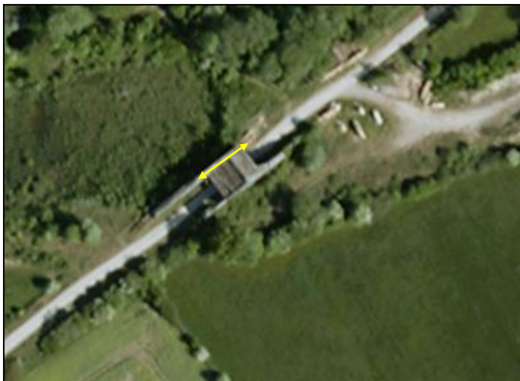
Vue aérienne de l'ancien saut de mouton du Breuil

Si cette fiche comporte des erreurs ou des oublis, merci de nous le signaler.