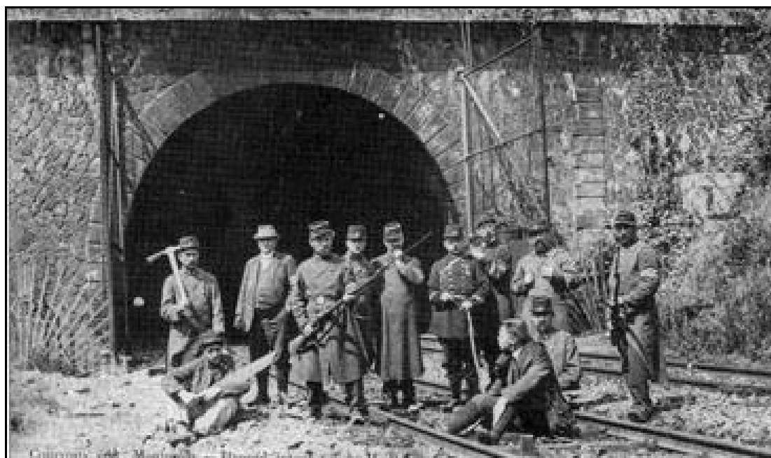
Au début de la guerre, groupe de soldats français de garde au tunnel A l'arrière-plan, noter les grilles pour fermer le tunnel

Enfin, en 1914 et en 1940, alors que le tunnel est hors usage, les Allemands construisent une voie de contournement à travers les rues de Montmédy, afin d'assurer la continuité du trafic.