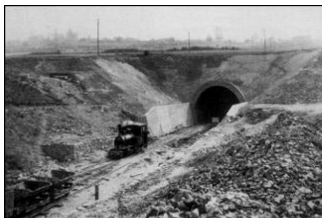
Côté entrée et côté sortie, les travaux de reconstruction entrepris par les Allemands La flèche jaune indique la petite galerie percée par les Allemands pour retrouver la galerie initiale