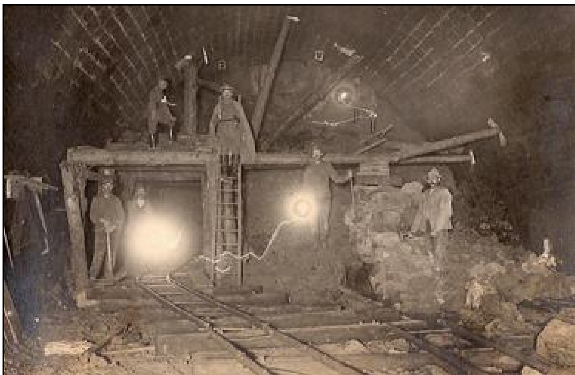
Ci-contre, travaux de reconstruction dans la galerie, sous surveillance allemande

Par ailleurs, les Allemands ne pouvant attendre la remise en état du tunnel, une déviation ferroviaire est aménagée en plein cœur de la ville basse pour contourner par le sud la colline de la citadelle.