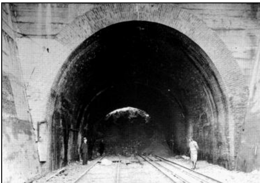
La sortie du tunnel à nouveau détruit durant la seconde guerre mondiale