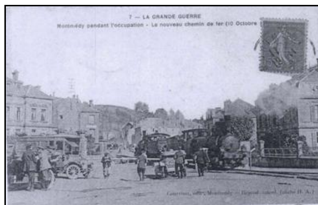
Ci-dessus et ci-dessous, trois vues de la déviation ferroviaire allemande installée au travers de la ville