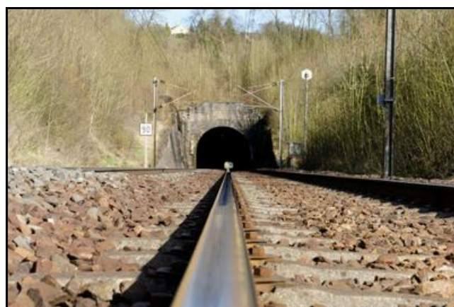
Ci-dessus et ci-après, la sortie du tunnel aujourd'hui et avant la première guerre mondiale