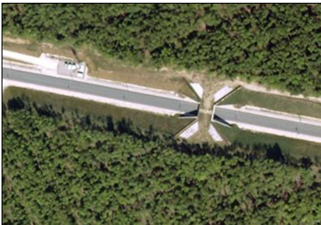
Vue aérienne du faux tunnel de Bois le Comte

Si cette fiche comporte des erreurs ou des oublis, merci de nous le signaler.