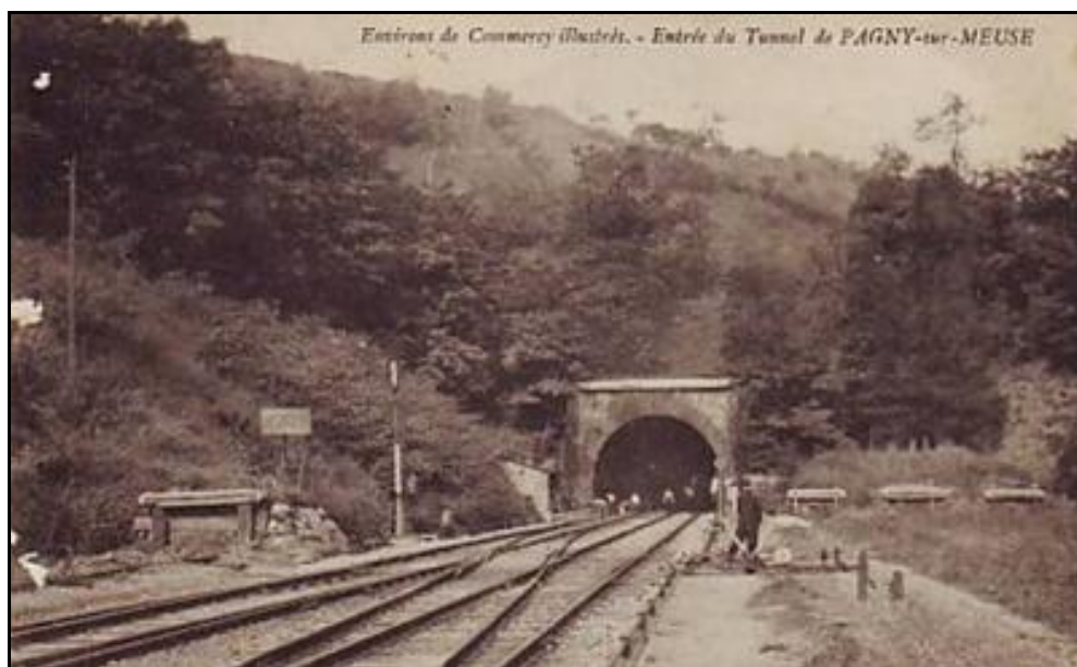
La sortie du tunnel à l'époque de la vapeur

Si cette fiche comporte des erreurs ou des oublis, merci de nous le signaler.