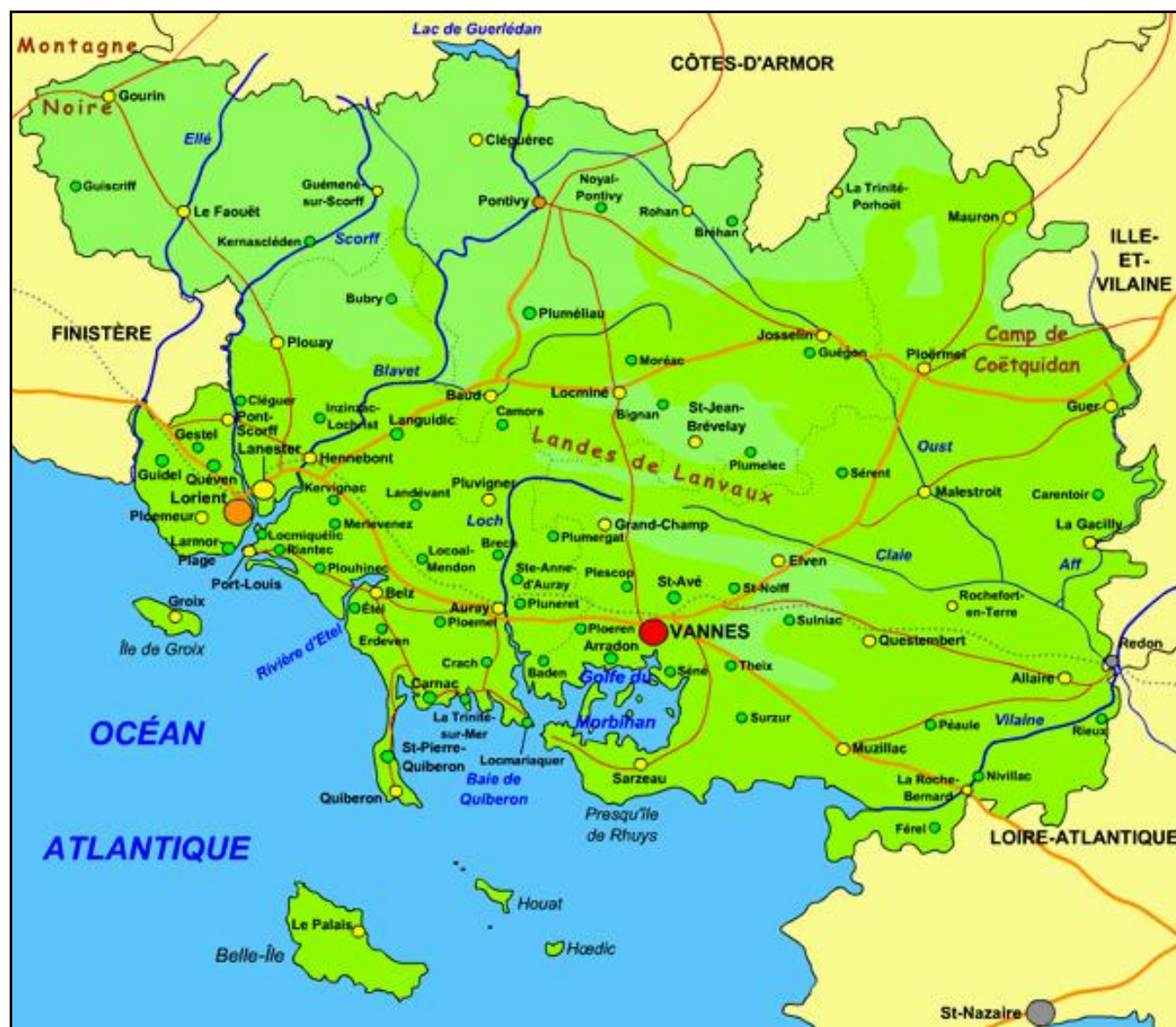
Réseau ferroviaire du Morbihan en 1920

Si vous pouvez nous apporter des détails complémentaires, ou si cette notice comporte des erreurs, merci de nous le signaler.