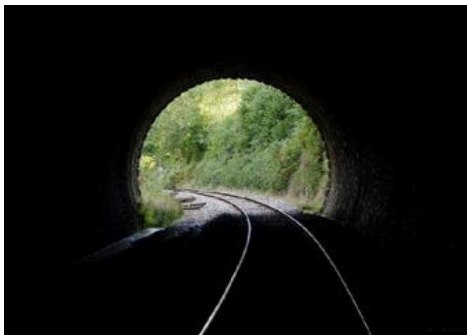
L'entrée et la sortie vues de l'intérieur de la galerie

Si cette fiche comporte des erreurs ou des oublis, merci de nous le signaler.