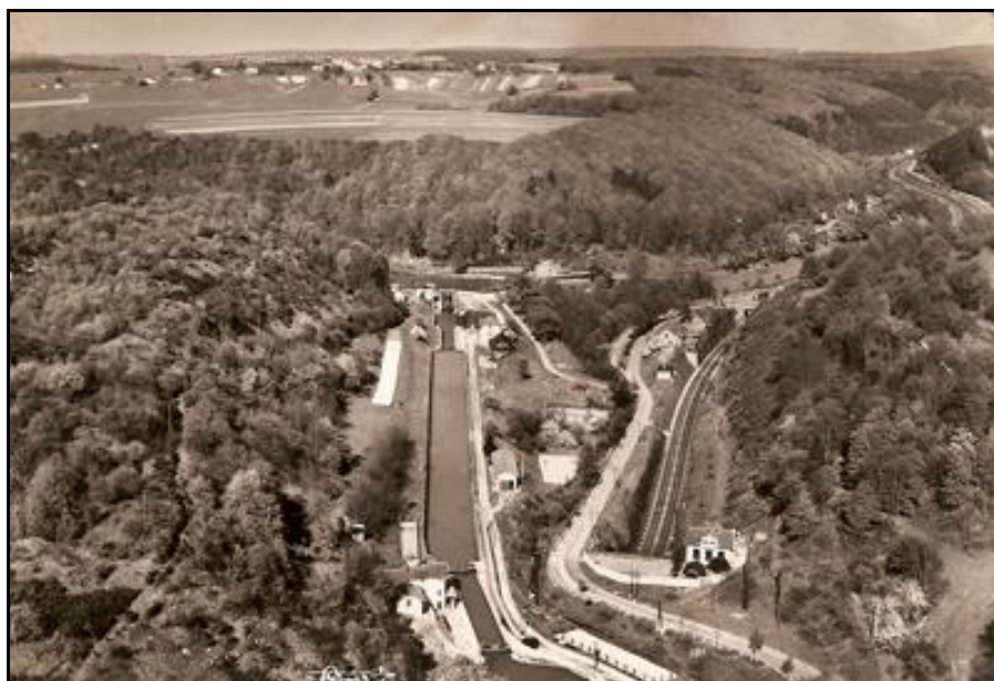
Et vue prise à l'est montrant la voie ferrée ressortant sous le canal dont la galerie est légèrement plus courte que la galerie ferroviaire

Enfin, le tunnel de Silwingen est un tunnel frontalier allemand (avec entrée et sortie en Allemagne) dont la partie centrale (un tiers environ de la longueur totale) passe sous la commune de Waldwisse, en France. C'est le seul cas d'un tunnel étranger passant sous le territoire national.