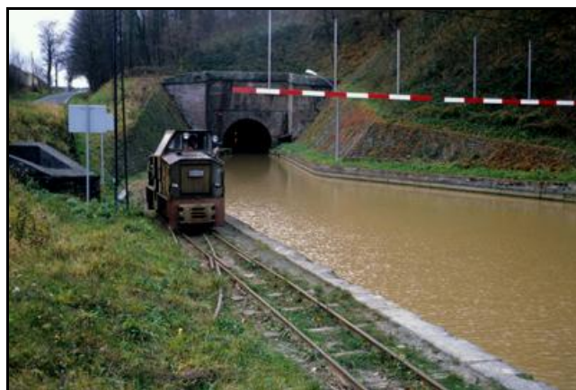
Belle photo montrant la sortie du tunnel peu de temps avant la fin du halage ferroviaire