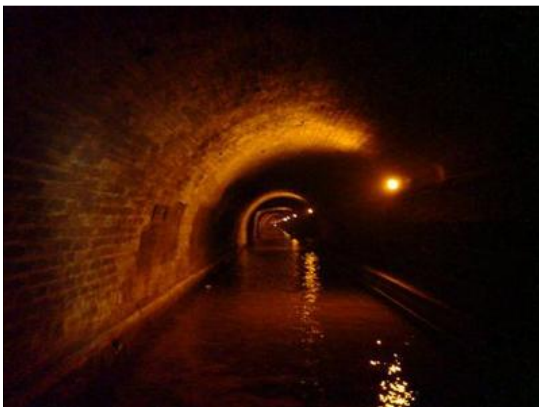
Ci-dessus et ci-dessous, la longue voûte marinière