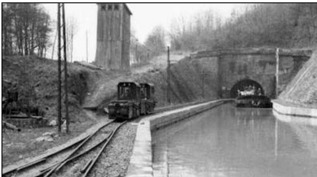
Halage ferroviaire, une époque révolue

Si cette fiche comporte des erreurs ou des oublis, merci de nous le signaler.