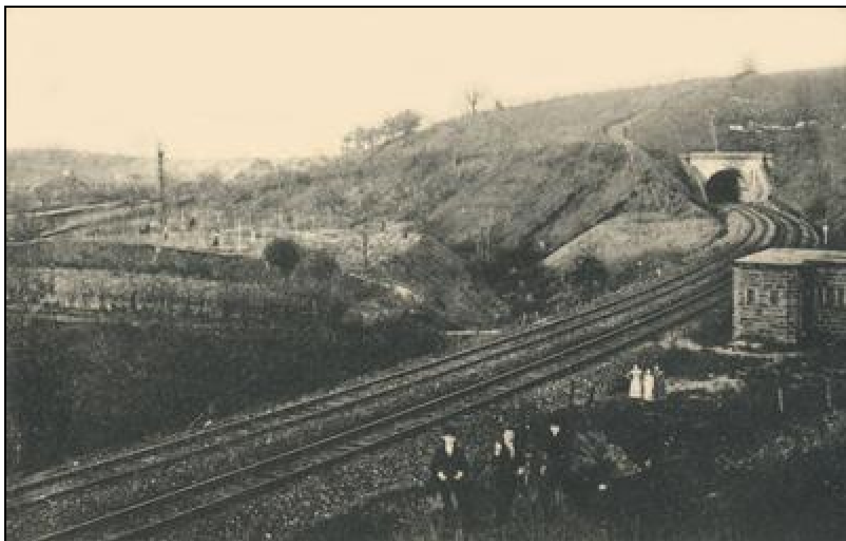
Photo ancienne de l'entrée du tunnel de Bouzonville 2 Avec, au premier plan, un ouvrage militaire défensif chargé de protéger l'accès des deux tunnels

Si cette fiche comporte des erreurs ou des oublis, merci de nous le signaler.