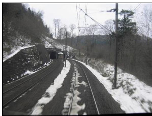
A droite, en partie cachée, la sortie de la galerie V2

Si cette fiche comporte des erreurs ou des oublis, merci de nous le signaler.