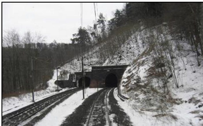
La galerie V2 est ici à gauche