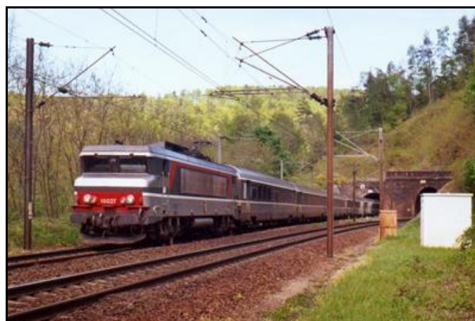
Un train remontant vers Paris sort de la galerie V2