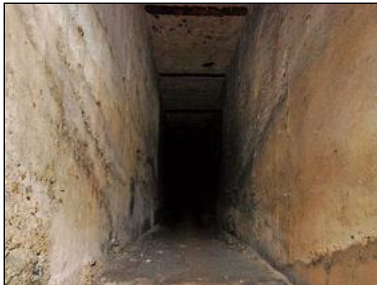
L'escalier et le couloir borgne, sans les fourneaux de minage

Si cette fiche comporte des erreurs ou des oublis, merci de nous le signaler.