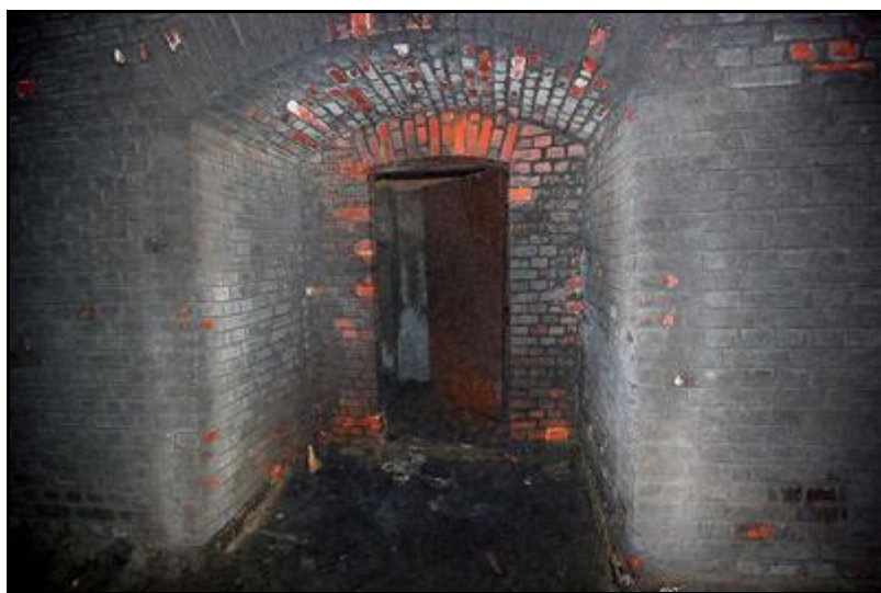
L'entrée du dispositif militaire de minage inachevé