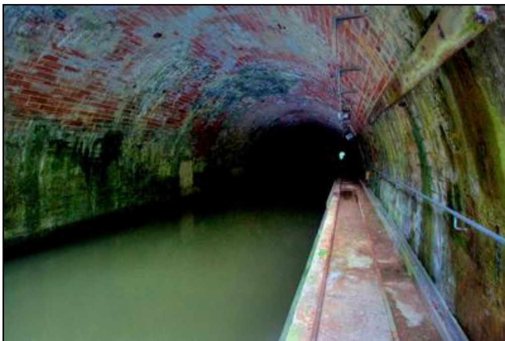
Ci-dessus et ci-dessous, la galerie de la voûte de Niderviller