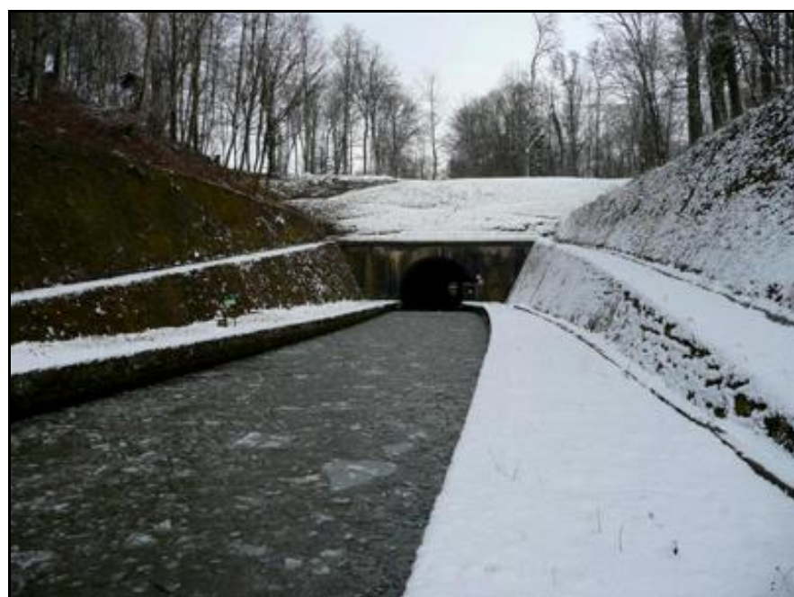
Ci-contre, hiver été, deux aspects saisonniers de l'entrée de la voûte de Niderviller