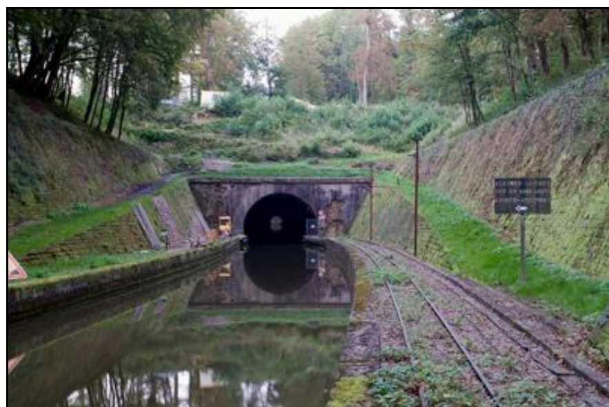
Sur la photo ci-dessous, noter la présence bien visible du chemin de fer Decauville de halage