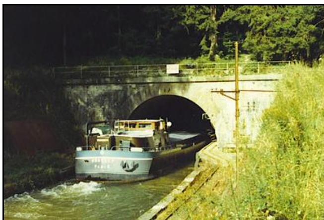
Photo ancienne de l'entrée montrant la voie Decauville de halage