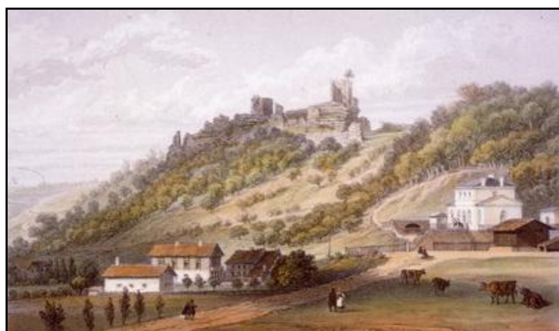
Gravures anciennes montrant la gare, l'entrée et la sortie du tunnel sous la colline du château

Si cette fiche comporte des erreurs ou des oublis, merci de nous le signaler.