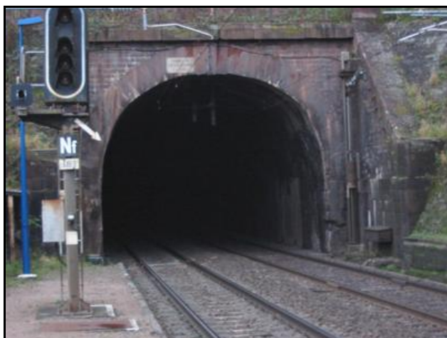
Ci-contre, gros plan sur l'entrée du tunnel