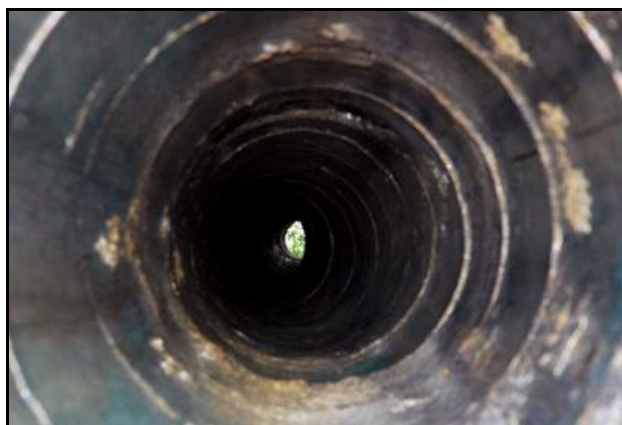
L'intérieur du conduit

Si cette fiche comporte des erreurs ou des oublis, merci de nous le signaler.