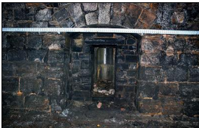
La niche équipée d'une cheminée d'aération décentrée