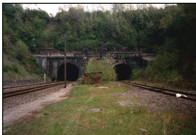
Photo ancienne montrant le tunnel Sud encore occupé par une voie