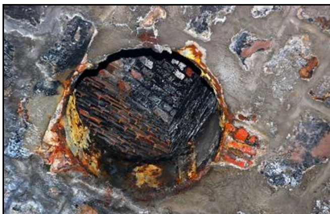
La prise d'air en voûte