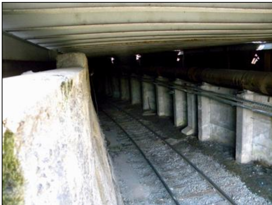
Une galerie résolument moderne et industrielle avec son gros tuyau