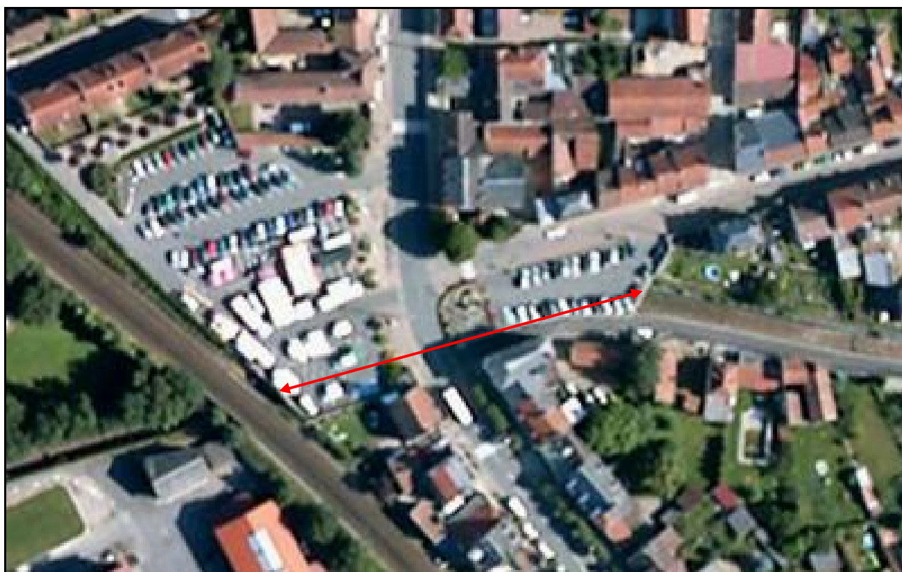
Vue aérienne du faux tunnel de l'Usine de Chazeau

Si cette fiche comporte des erreurs ou des oublis, merci de nous le signaler.