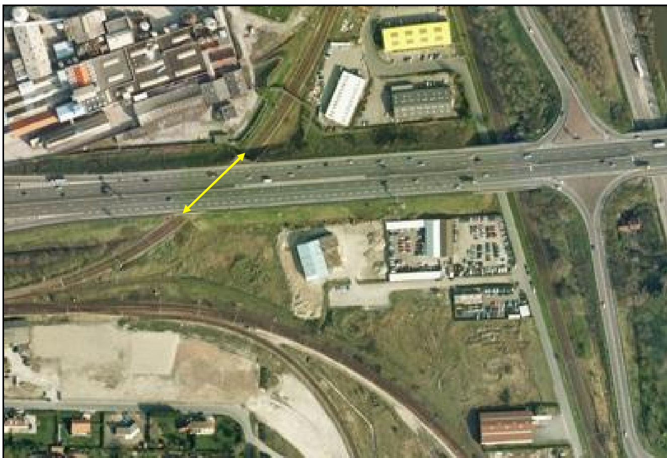
Vue aérienne de la galerie de l'Autoroute A 16

Si cette fiche comporte des erreurs ou des oublis, merci de nous le signaler.