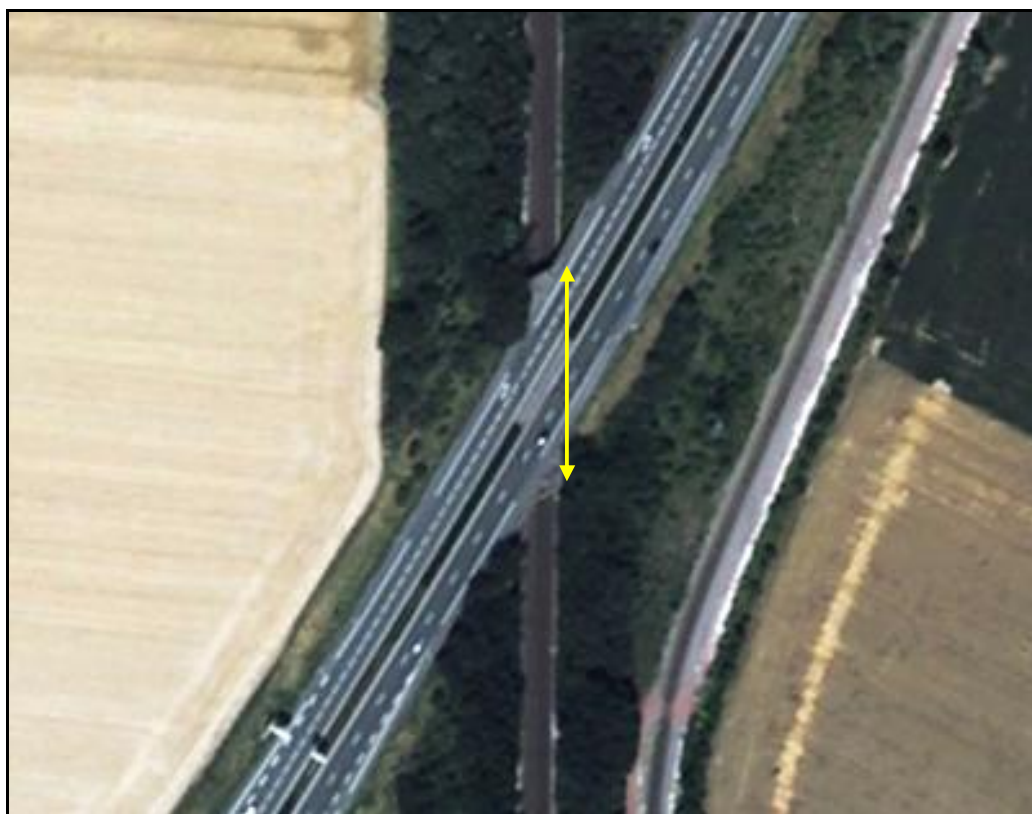
Vue aérienne de la galerie de Hordain

Si cette fiche comporte des erreurs ou des oublis, merci de nous le signaler.