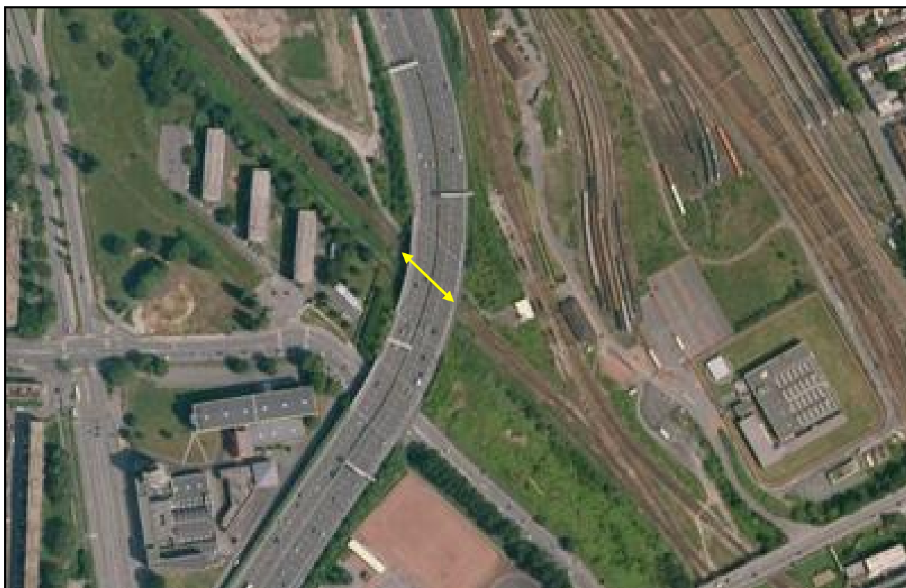
Vue aérienne de la galerie de la Route Nationale 356

Si cette fiche comporte des erreurs ou des oublis, merci de nous le signaler.