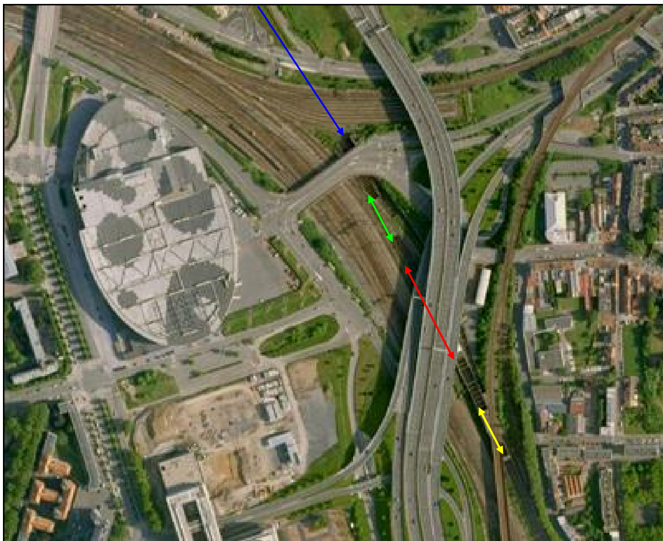
Vue aérienne des galeries de Becquerel Flèche jaune : saut de mouton de Becquerel Sud Flèche rouge : faux tunnel de l'Echangeur LGV Flèche verte : saut de mouton de Becquerel Nord LGV Flèche bleue : faux tunnel de Lille Europe LGV

Si cette fiche comporte des erreurs ou des oublis, merci de nous le signaler.