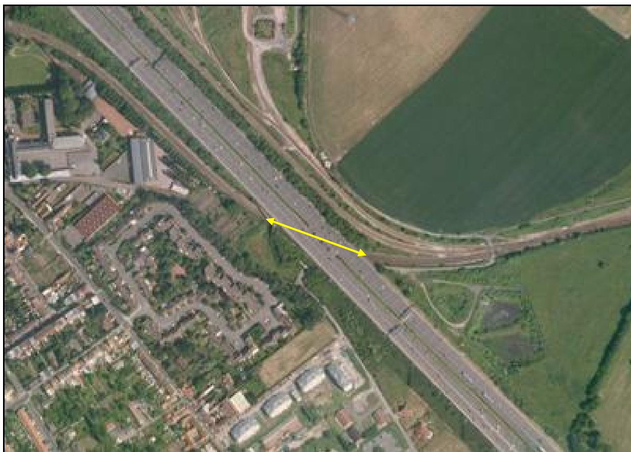
Vue aérienne de la galerie de Ronchin

Si cette fiche comporte des erreurs ou des oublis, merci de nous le signaler.