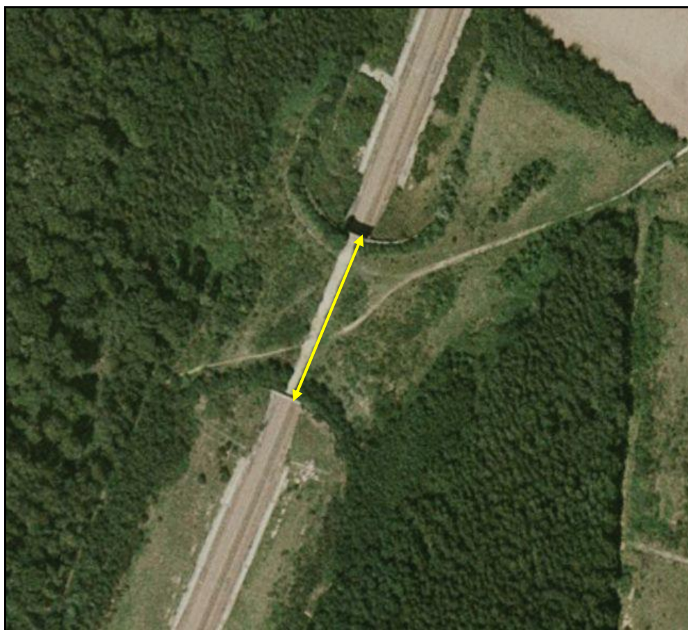
Vue aérienne de la galerie des Bois Plantés

Si cette fiche comporte des erreurs ou des oublis, merci de nous le signaler.