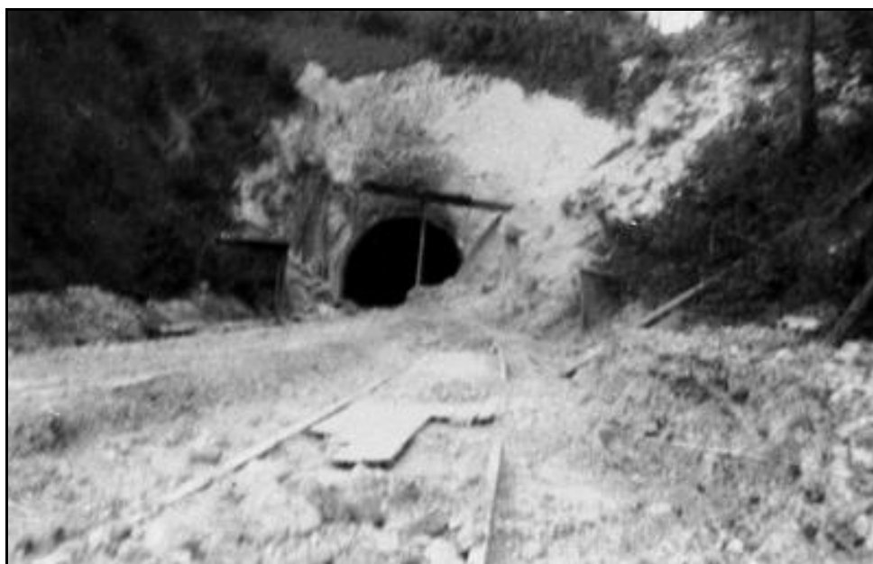
L'entrée du tunnel suite aux bombardements de l'aviation alliée Au premier plan, une voie de secours temporaire destinée à permettre le passage des trains

En octobre 1942, le poste de commandement du maréchal Göring fut déplacé et un autre état major aérien lui succéda. Le tunnel fit l'objet de quelques bombardements alliés en 1944 comme nombre d'autres ouvrages ferroviaires. Enfin, les Allemands procédèrent à diverses destructions dans le village et aux abords du tunnel lorsqu'ils abandonnèrent les lieux.