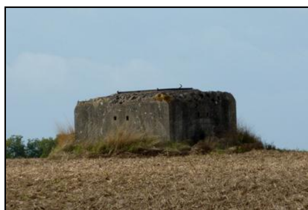
Le débouché des deux cheminées d'aération renforcées façon blockhaus par les Allemands A gauche la cheminée n° 1, et à droite la cheminée n° 2

Si cette fiche comporte des erreurs ou des oublis, merci de nous le signaler.