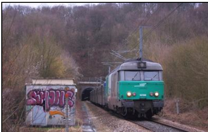
L'entrée et la sortie du tunnel, hier et aujourd'hui