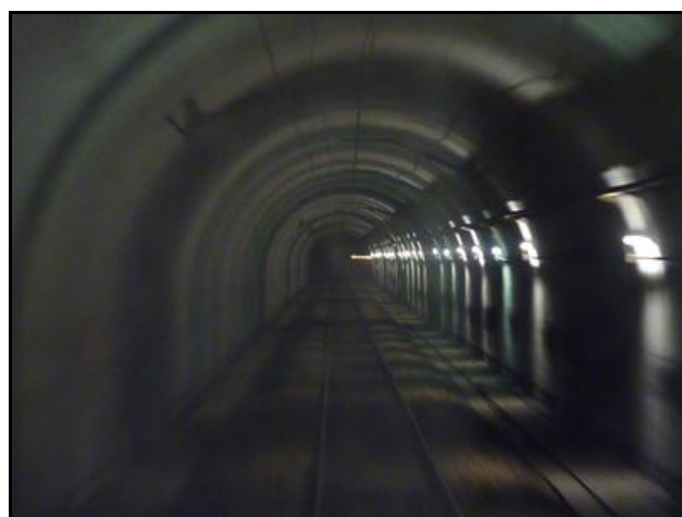
Ci-dessus et ci-dessous, divers aspects de la galerie entièrement refaite