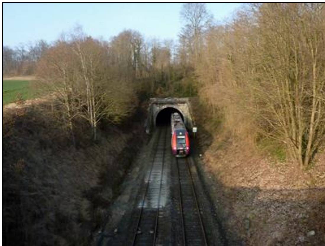
Un AGC sort de l'entrée du tunnel

Si cette fiche comporte des erreurs ou des oublis, merci de nous le signaler.