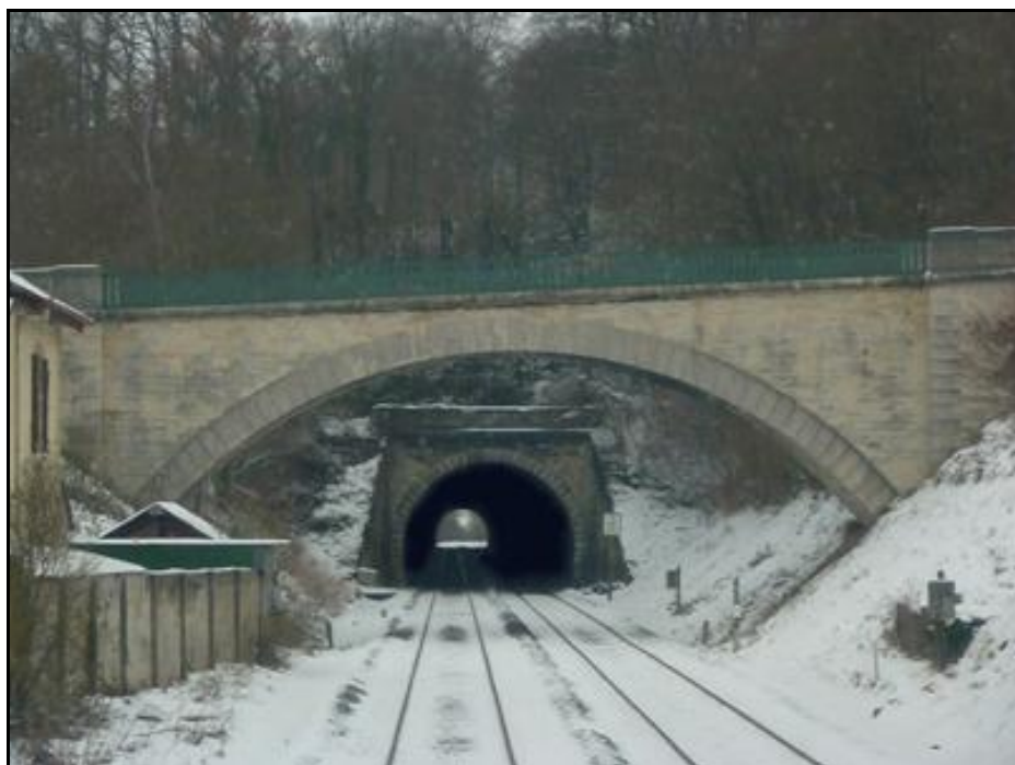
Ci-dessus et ci-dessous, ambiances hivernales