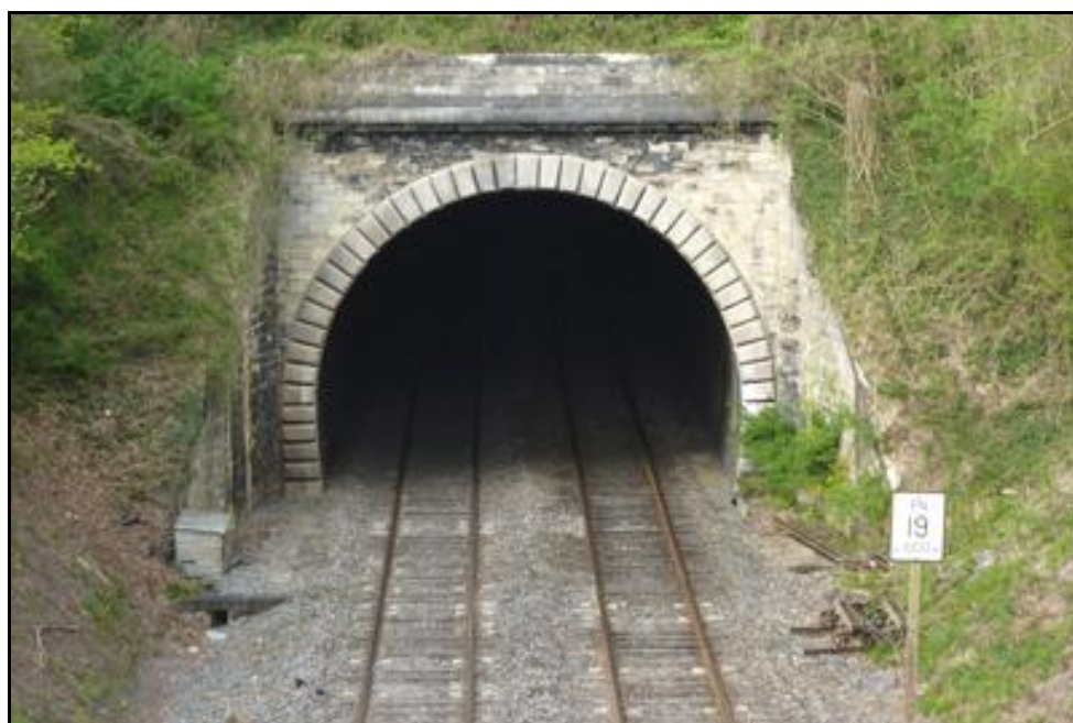
L'entrée du tunnel vue depuis le pont qui la précède