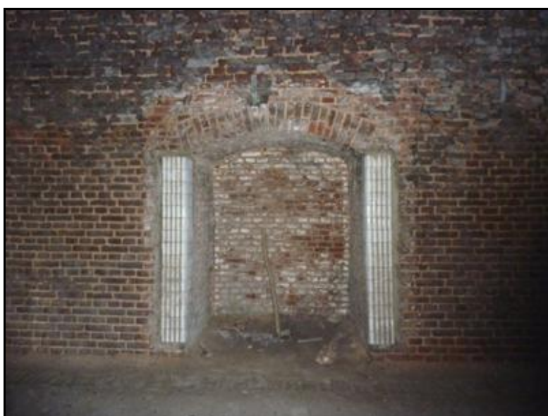
De belles niches façon dorique

Si cette fiche comporte des erreurs ou des oublis, merci de nous le signaler.