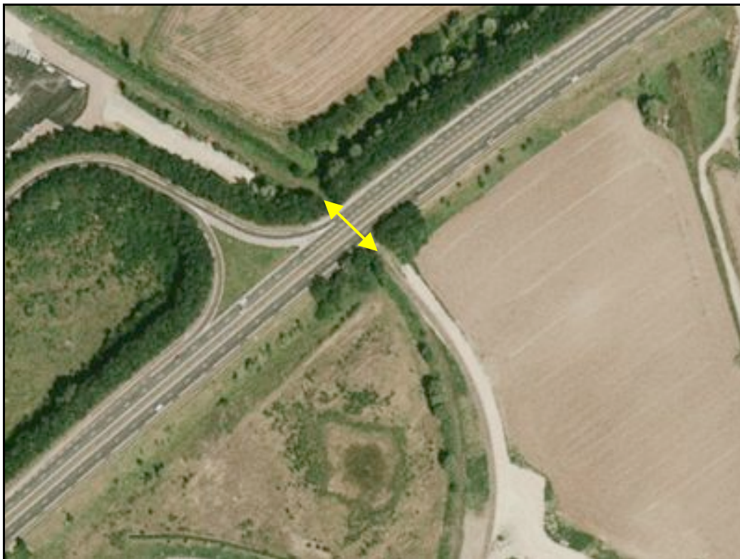
Vue aérienne de la galerie du Tourteret

Si cette fiche comporte des erreurs ou des oublis, merci de nous le signaler.