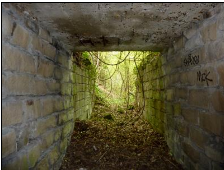
L'entrée du tunnel vue de l'intérieur