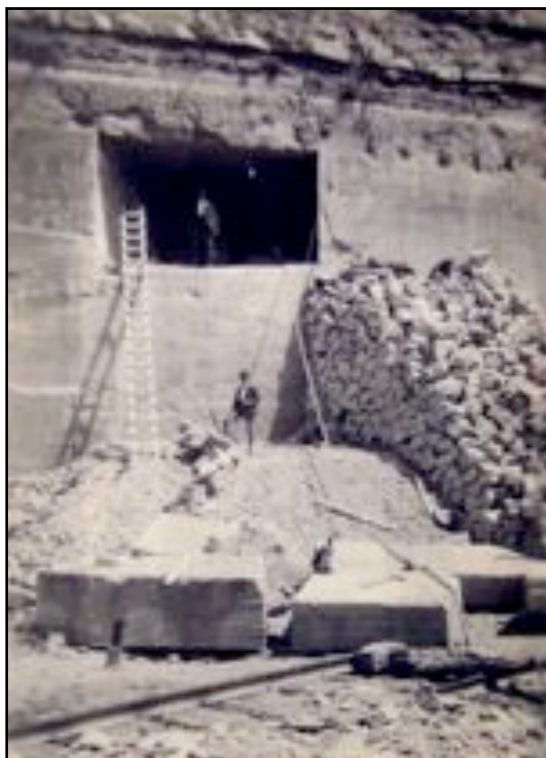
Ci-contre, le tunnel en cours de percement