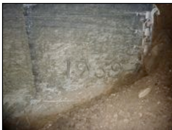
Ci-contre, date de finition du tunnel : 1932 Celui-ci a été le dernier creusé sur l'ensemble du site des carrières de Saint Maximin

Si cette fiche comporte des erreurs ou des oublis, merci de nous le signaler.