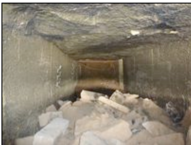
Ci-dessous, l'intérieur de la galerie avec le bouchon de déblais qui l'obstrue