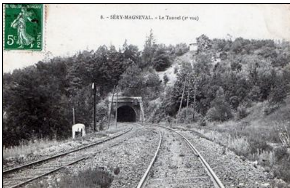
L'entrée du tunnel, du temps de la vapeur

Si cette fiche comporte des erreurs ou des oublis, merci de nous le signaler.