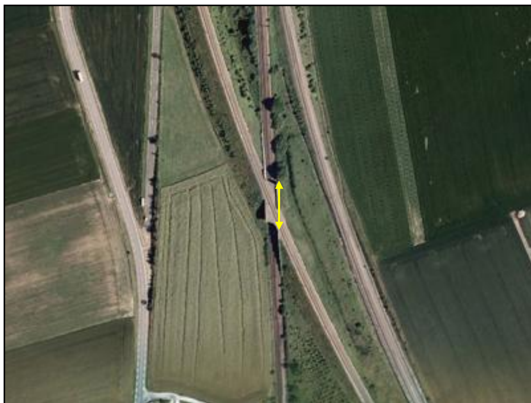
Vue aérienne du saut de mouton

Si cette fiche comporte des erreurs ou des oublis, merci de nous le signaler.