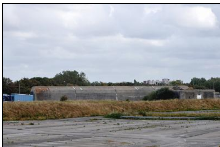
Vue latérale du Dombunker et de son blockhaus à munitions

Si cette fiche comporte des erreurs ou des oublis, merci de nous le signaler.