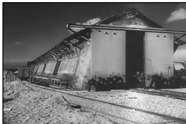
Deux photos de la sortie du Dombunker de Calais équipé d'un toit de camouflage pour faire croire à une inoffensive bâtisse Sur la photo de gauche, l'arrière d'un K5 est visible