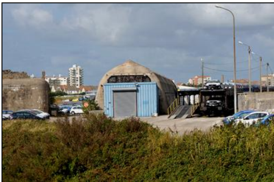
La sortie du Dombunker avant installation des gaines de ventilation qui le défigurent A gauche, le blockhaus à munitions