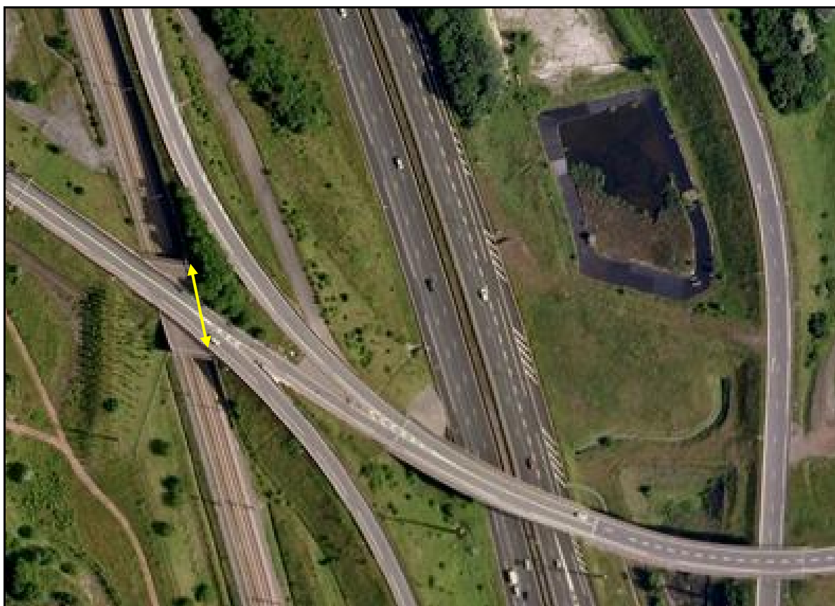
Vue aérienne de la galerie sous l'une des bretelles de l'autoroute A 21

Si cette fiche comporte des erreurs ou des oublis, merci de nous le signaler.