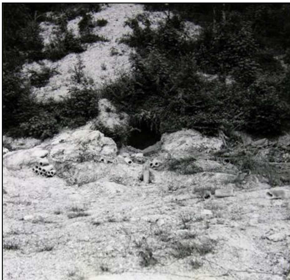
Entrée de l'un des tunnels de la Montagne de Lumbres avant sa destruction Les tubes abandonnés devant l'entrée sont des buses de canalisation pour faire des drains

Si cette fiche comporte des erreurs ou des oublis, merci de nous le signaler.