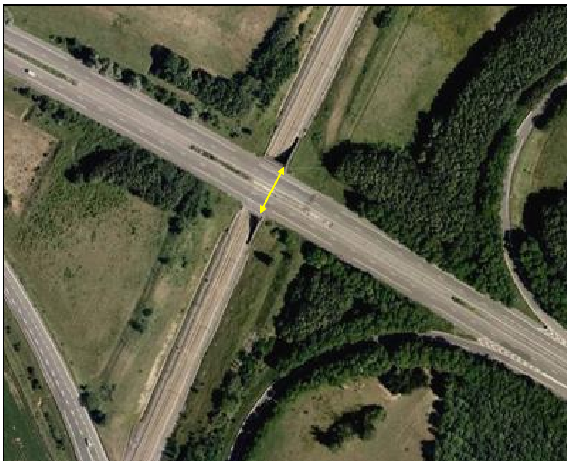
Vue aérienne de la galerie sous l'autoroute A 26

Si cette fiche comporte des erreurs ou des oublis, merci de nous le signaler.