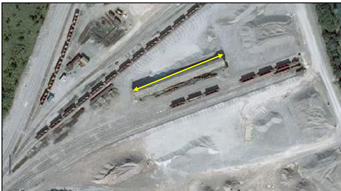
Vue aérienne du Dombunker d'Hydrequent, au milieu de la carrière de la Vallée Heureuse

Si cette fiche comporte des erreurs ou des oublis, merci de nous le signaler.