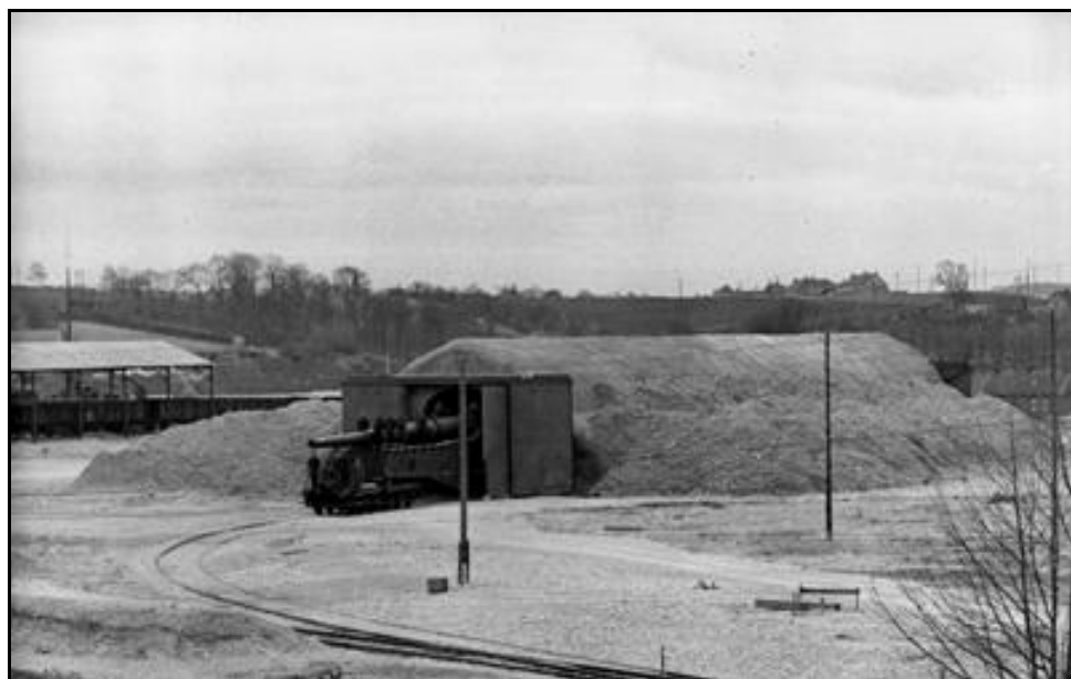
La sortie du Dombunker photographié pendant la guerre avec le canon qu'il abritait