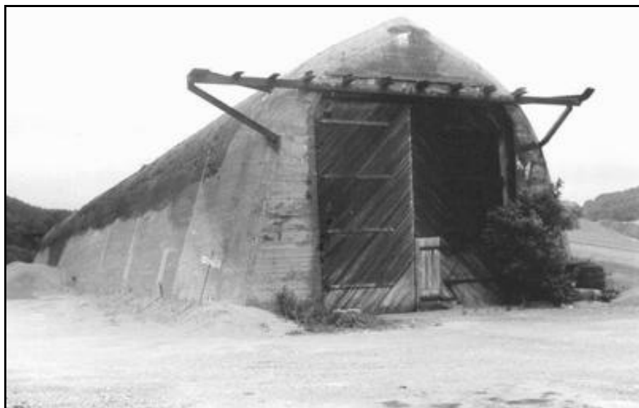
Autre vue de l'entrée du Dombunker