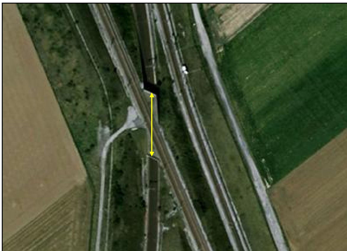
Vue aérienne du saut de mouton

Si cette fiche comporte des erreurs ou des oublis, merci de nous le signaler.