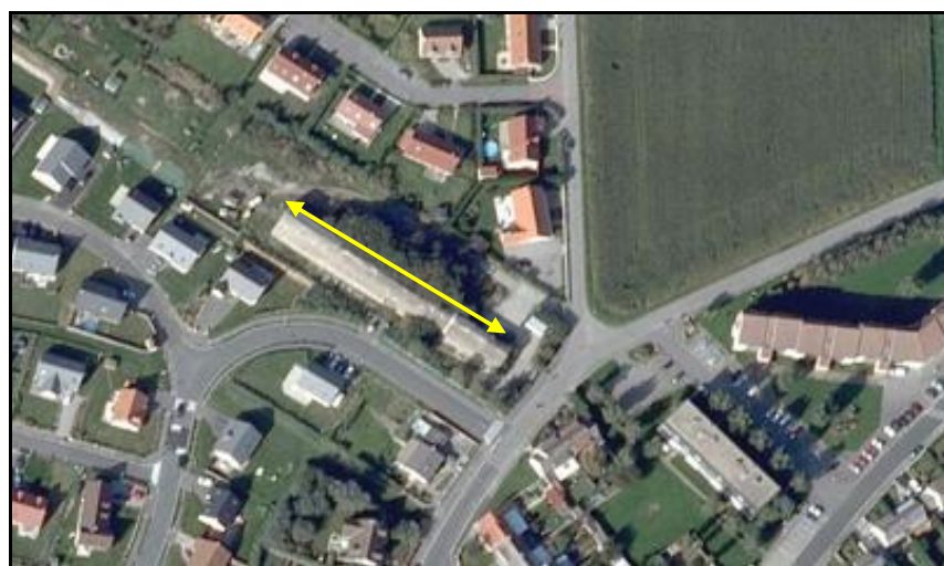
Ci-contre, vue aérienne du Dombunker des Garennes Les pavillons voisins donnent une idée de sa taille

Si cette fiche comporte des erreurs ou des oublis, merci de nous le signaler.