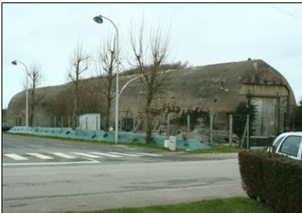
Trois vues extérieures du Dombunker des Garennes