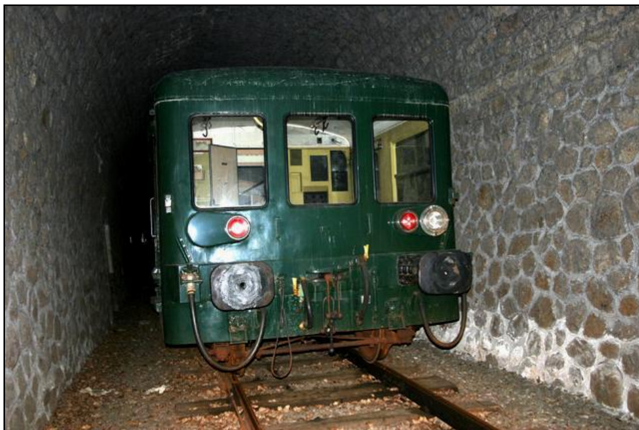
Un type de rencontre à éviter dans les tunnels

Si cette fiche comporte des erreurs ou des oublis, merci de nous le signaler.