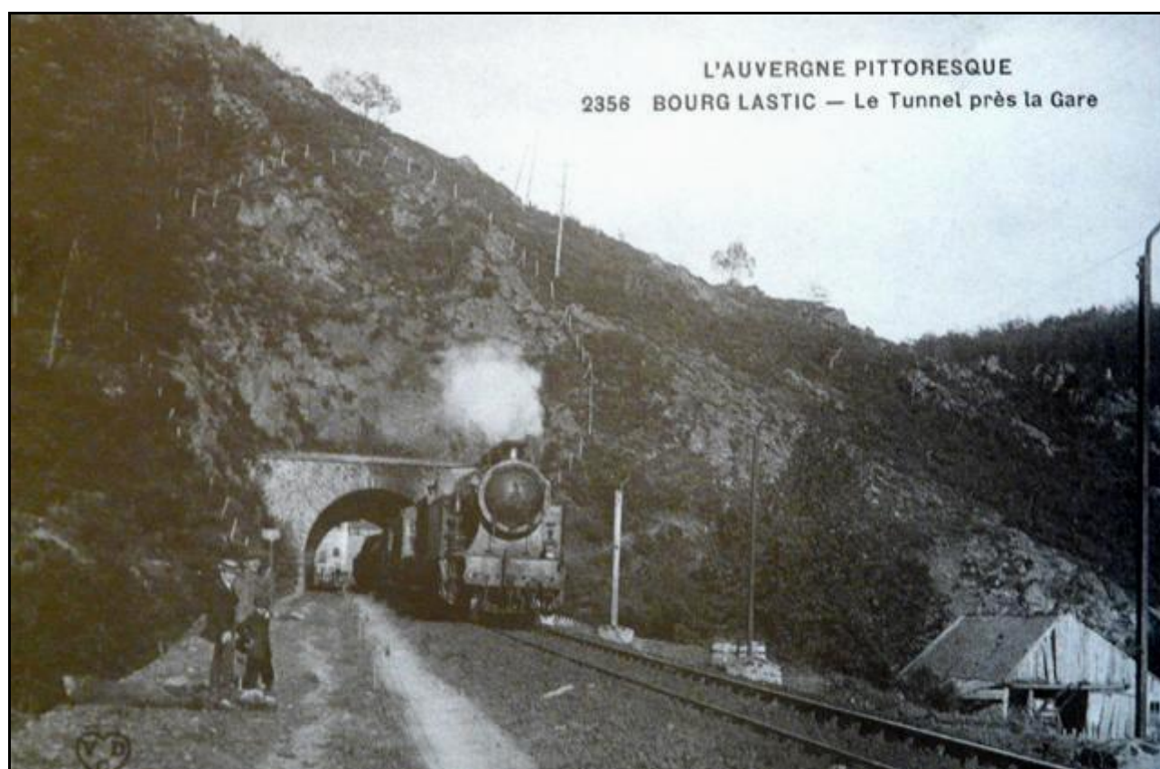
Photo prise après guerre, peu après le retrait de la deuxième voie

Si cette fiche comporte des erreurs ou des oublis, merci de nous le signaler.