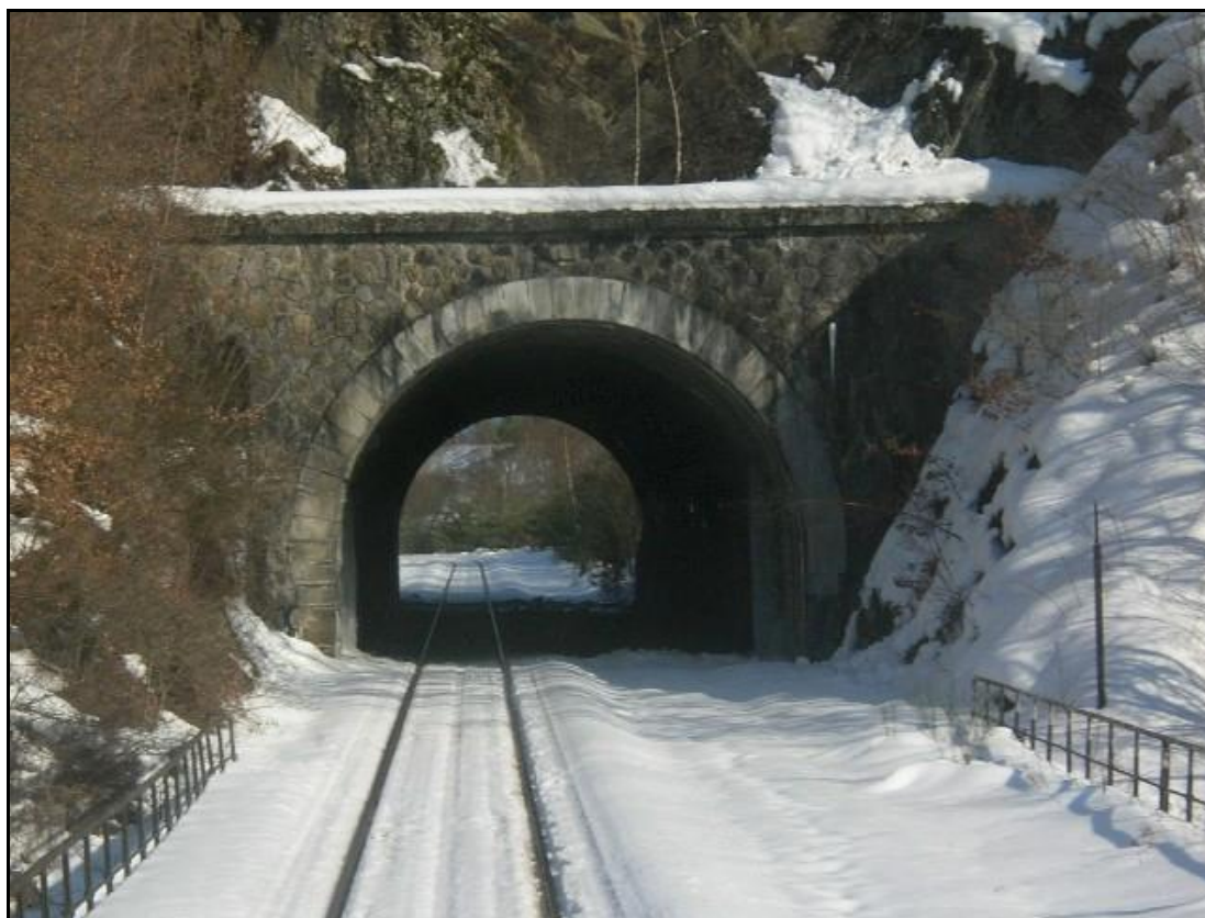
L'entrée du tunnel en hiver