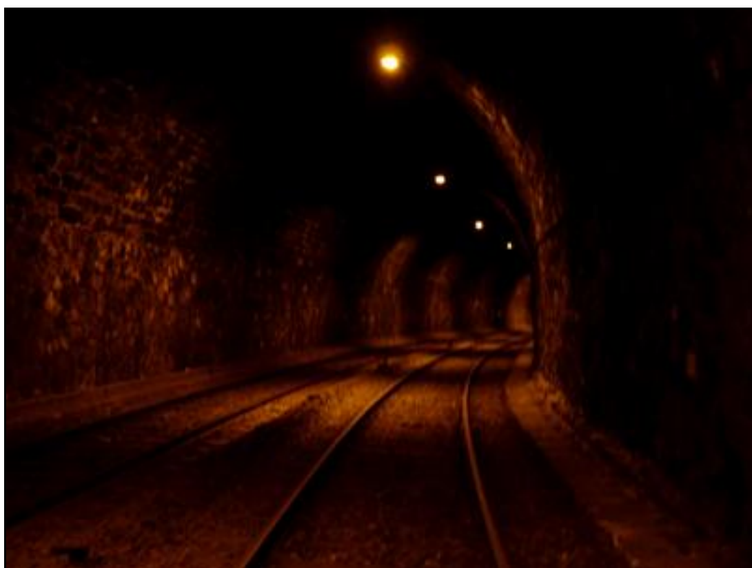
La galerie dans son état initial avant travaux L'éclairage est disposé temporairement pour la durée des travaux