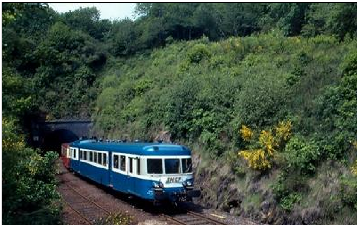
Un autorail descendant vers Clermont sort du tunnel de Varoux

Si cette fiche comporte des erreurs ou des oublis, merci de nous le signaler.