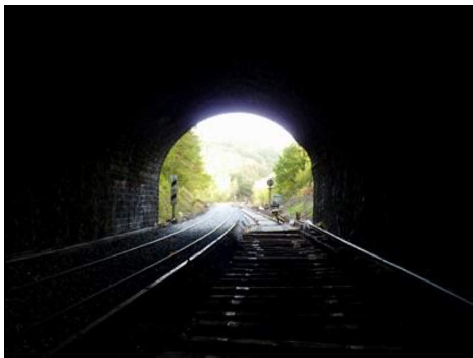
L'entrée du tunnel en travaux

Si cette fiche comporte des erreurs ou des oublis, merci de nous le signaler.