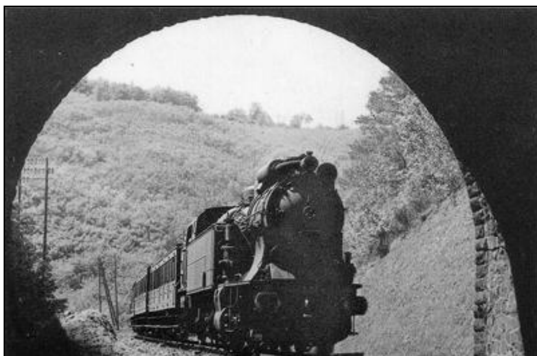
Un train montant vers le Mont Dore s'engouffre dans le tunnel La photo est prise du temps où les deux voies n'existaient pas encore.