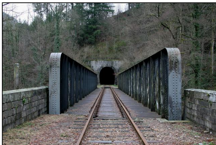
Juste avant l'entrée, pont métallique sur la Dore

Au premier plan, les joints de dilatation des rails correspondant au pont métallique ci-dessous