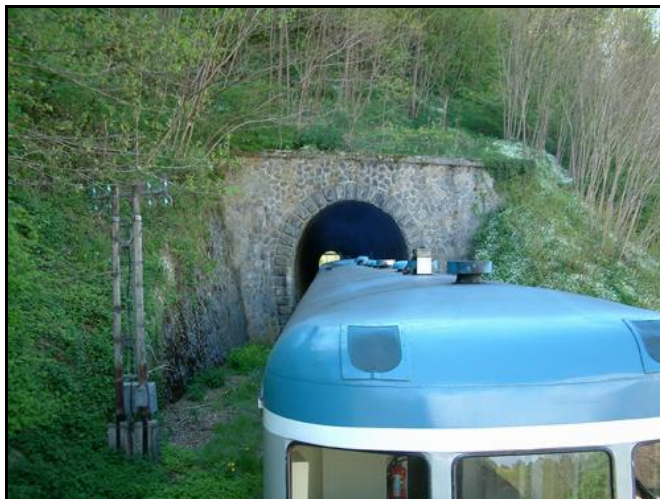
Deux autres photos originales de l'entrée et de la sortie du tunnel d'Olliergues

Si cette fiche comporte des erreurs ou des oublis, merci de nous le signaler.