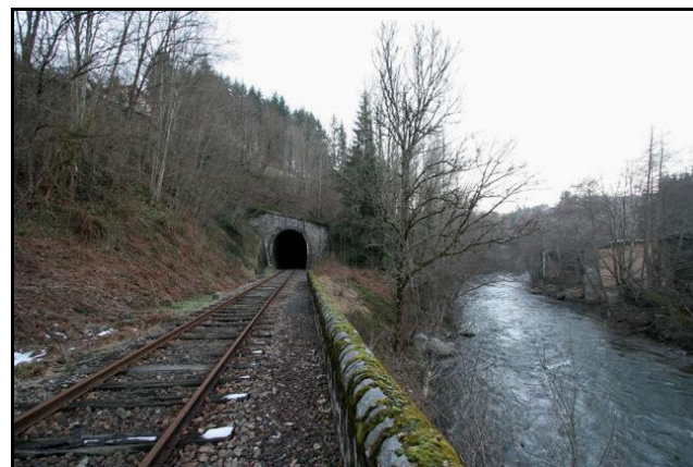
Le tunnel et la Dore