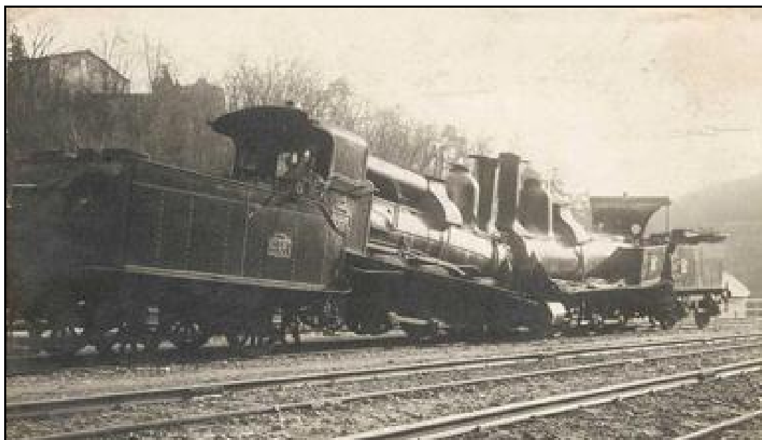
Les locomotives accidentées extraites du tunnel ont été replacées en position sur une voie de service de la gare d'Olliegues pour les besoins de l'enquête

Un problème de mauvaise compréhension dans les dépêches échangées entre les gares voisines serait à l'origine de cet accident, la gare d'Olliegues ayant donné voie libre alors qu'elle ne l'était pas.