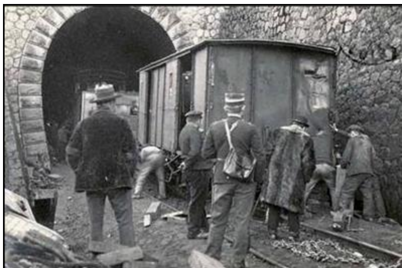
Extraction du matériel accidenté et du fourgon qui a atténué le choc