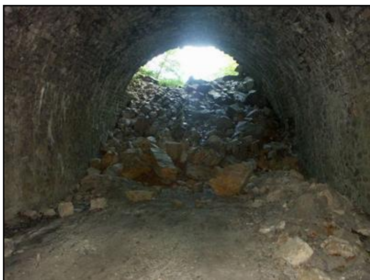
Un bien triste travail