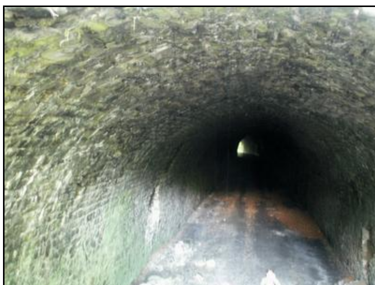
Le reste de la galerie en bon état derrière l'éboulement d'entrée

Si cette fiche comporte des erreurs ou des oublis, merci de nous le signaler.