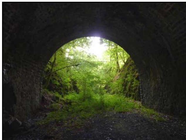
Ci-dessus et ci-dessous, l'entrée et la sortie vues de l'intérieur