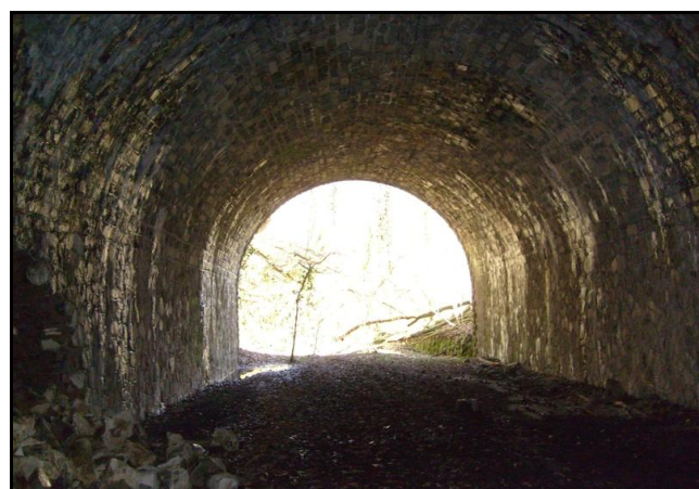
Ci-dessus et ci-dessous, la galerie du tunnel et le lâchage de piédroit