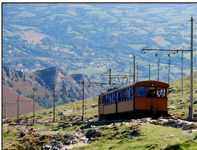
Le petit train de la Rhune

Aujourd'hui les tunnels du pays basque se concentrent essentiellement sur deux grands axes :