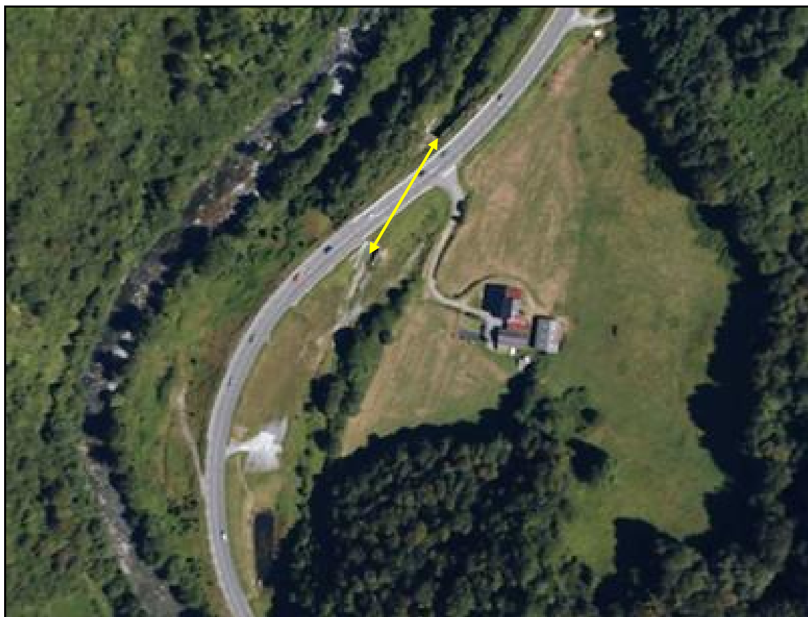
Vue aérienne de la galerie

Si cette fiche comporte des erreurs ou des oublis, merci de nous le signaler.