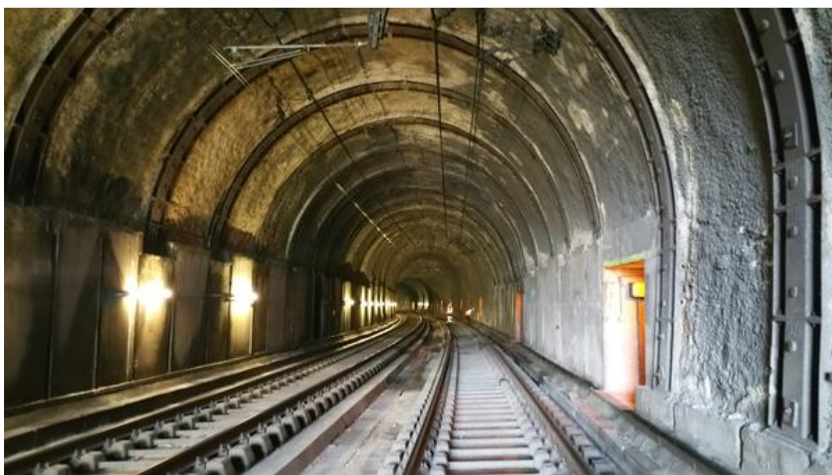
Vue depuis l'entrée (29/08/2019)

Si cette fiche comporte des erreurs ou des oublis, merci de nous le signaler.