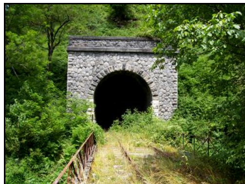
Ci-dessus et ci-dessous, l'entrée et la sortie du tunnel en d'autres temps