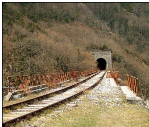
La sortie du tunnel et le viaduc d'Urdos