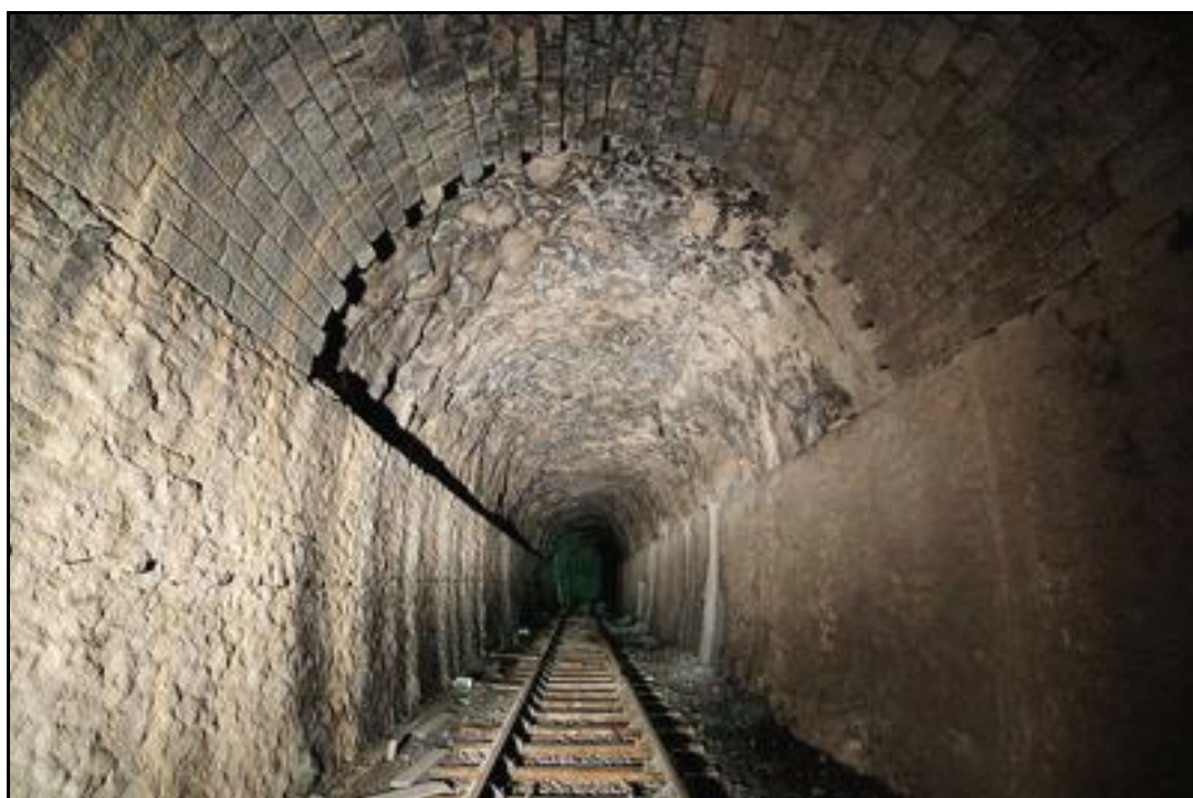
Ci-dessus et ci-dessous, divers aspects de la galerie